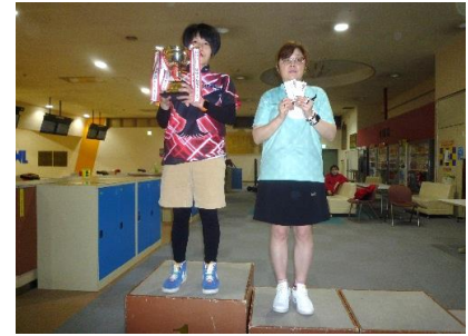
写真 上段左:シングルス戦 上段中:ダブルス戦 上段右:チーム戦 下段左:オールイベント戦男子 下段右:オールイベント戦女子